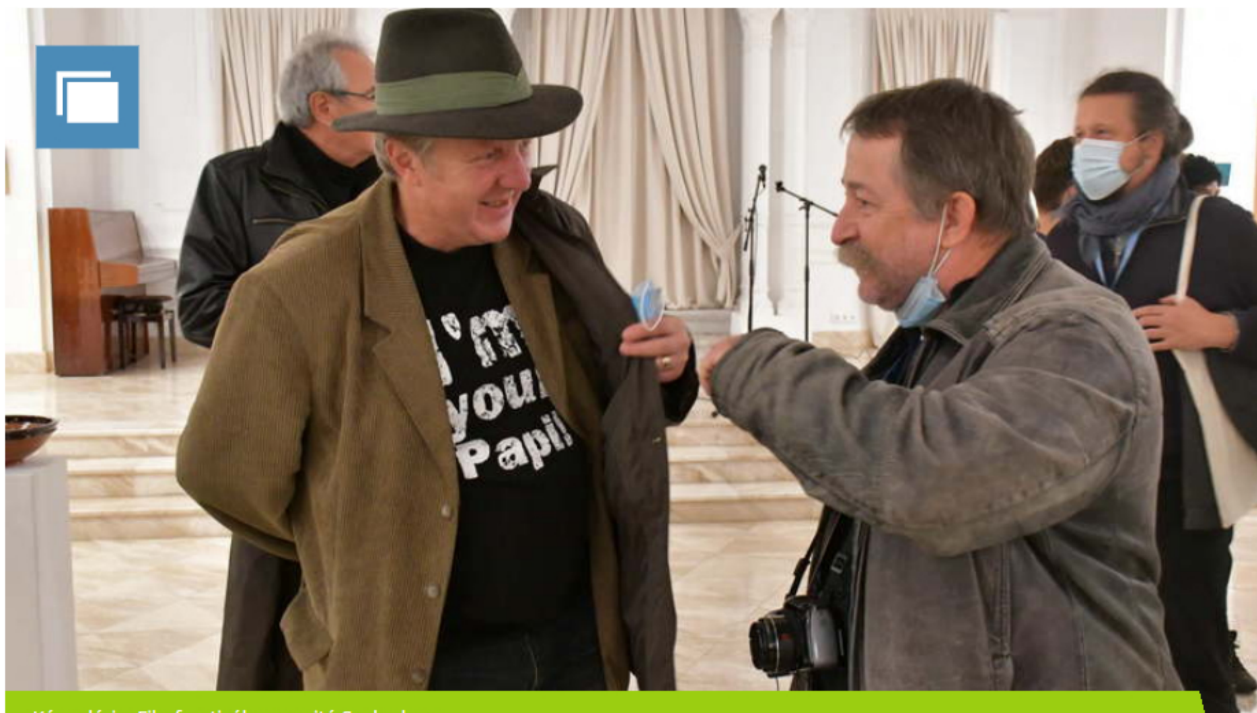
Képgaléria: Filmfesztivál-megnyitó Szolnokon